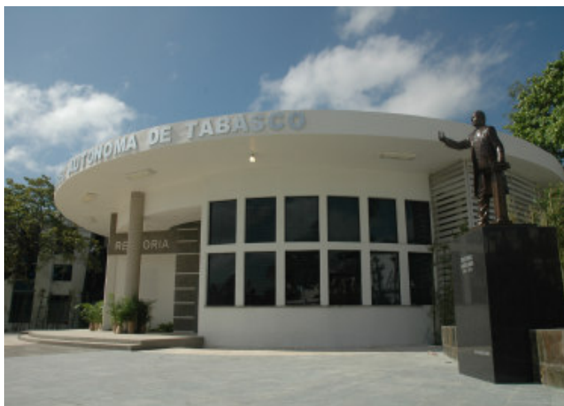
RECTORIA. Universidad Juárez Autónoma de Tabasco. Villahermosa, Tabasco. México.

Por ello, es importante que todos y cada uno de los profesores, participen compartiendo sus experiencias académicas en los diferentes foros de análisis como una evidencia de su compromiso con la institución y esforzándose diariamente para lograr construir una institución líder en el sureste mexicano y reconocida por su trabajo innovador de calidad.