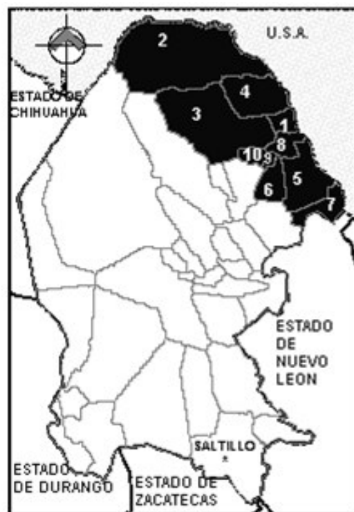
MAPA DE LA UBICACIÓN DE LA REGIÓN NORTE EN EL ESTADO DE COAHUILA.