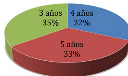
Figura 1. Años viviendo en el Fraccionamiento.

Los servicios con los que cuentan las familias son: educación, seguridad, alumbrado, zonas recreativas, limpia y agua; de los servicios antes descritos, el de agua potable representa para todas las familias una muy mala calidad, debido a que el olor y color es desagradable. A continuación, se presenta la siguiente gráfica de acuerdo a los años que algunas familias llevan viviendo en el Fraccionamiento.