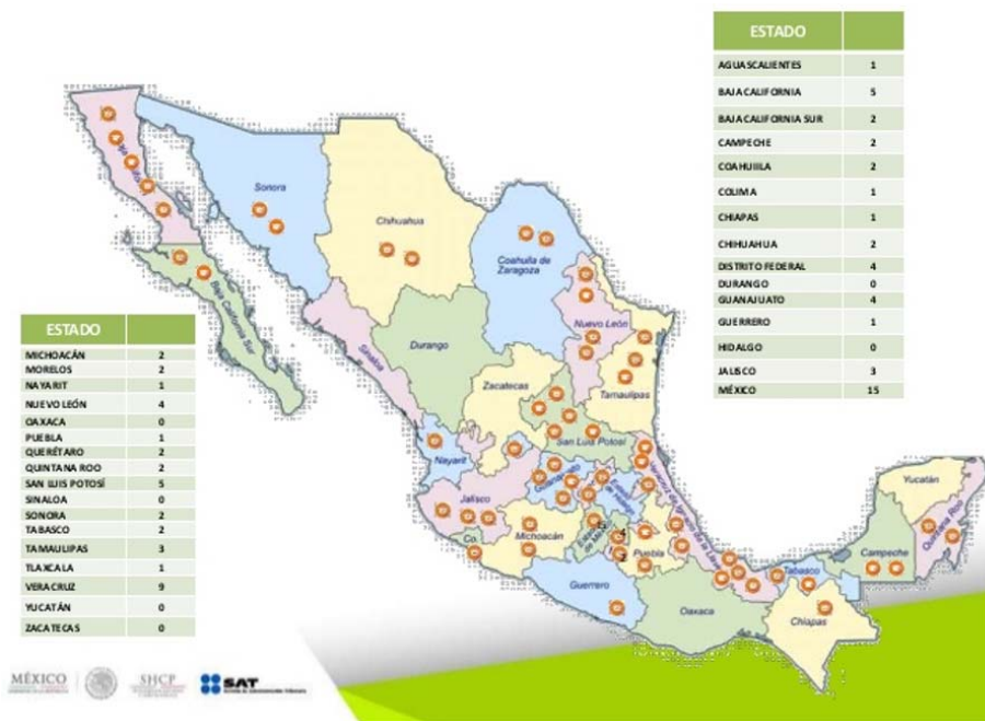
Figura 1. Distribución de Núcleos de Apoyo Fiscal en México.

En el año 2009 la Universidad Autónoma de San Luis Potosí (UASLP) estableció estrategias de vinculación con la Secretaría de Hacienda y Crédito Público (SHCP) del país a través de un convenio celebrado entre la Unidad Zona Media de esta Universidad con el SAT. En el año 2013 se renovó para extender sus operaciones en todos los campus universitarios establecidos en el Estado de San Luis Potosí. La última ratificación del interés de la Institución y la Dependencia Federal de mantener una estrecha relación para el cumplimiento de objetivos bilaterales fue en abril del 2014, apoyo legal para la instalación del NAF en la Facultad de Contaduría y Administración de San Luis Potosí, inaugurado el 13 de febrero del mismo año.