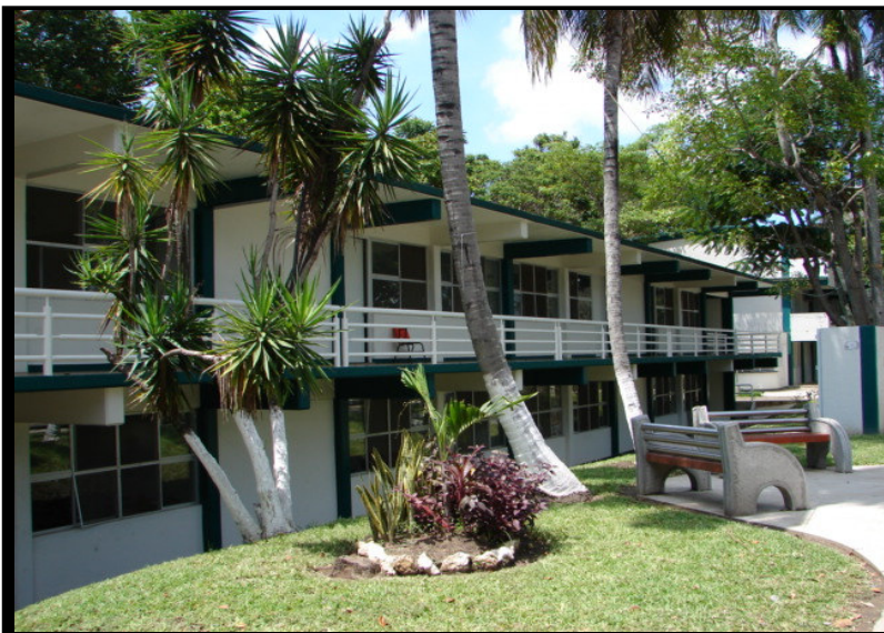
Instalaciones de la División Académica de Ciencias Económico Administrativas (DACEA). Universidad Juárez Autónoma de Tabasco. Villahermosa, Tabasco. México.

Los programas de Educación Continua de la División Académica Ciencias Económico Administrativas, ya sea presencial o a distancia, están creados a partir de la necesidad de las organizaciones y toda aquella persona que busca su actualización y su desarrollo integral, que les permita adquirir nuevos conceptos, estrategias para la solución de problemas en su ámbito laboral y mejorar su desempeño profesional y laboral, así como a la búsqueda de nuevas opciones que permitan incrementar la competitividad de las empresas públicas o privadas.